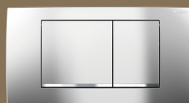
↑ mattverchromt 115.899.KN.1