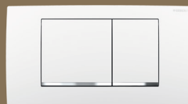
↑ weiß 115.899.KJ.1

Die Geberit Betätigungsplatte Twinline30 ist zusammen mit den Geberit Umbausets für Geberit Spülkästen ab Baujahr 1978 einsetzbar und eröffnet Zusatzgeschäfte im Bestand, wenn alte Unterputz-Spülkästen nicht getauscht werden sollen. Die Umbausets machen wesentliche Wassereinsparungen möglich. Alte Spülkästen können damit von 1-Mengen-Spültechnik mit Spül-Stopp auf 2-Mengen-Spülung umgerüstet werden. Bei der 2-Mengen-Spültechnik kann die große Spülmenge auf sechs Liter, die kleine auf drei Liter reduziert werden. Für die Umrüstung sind lediglich Heberglocke und Betätigungsplatte auszu-tauschen, alle Montageteile sind im Lieferumfang enthalten.