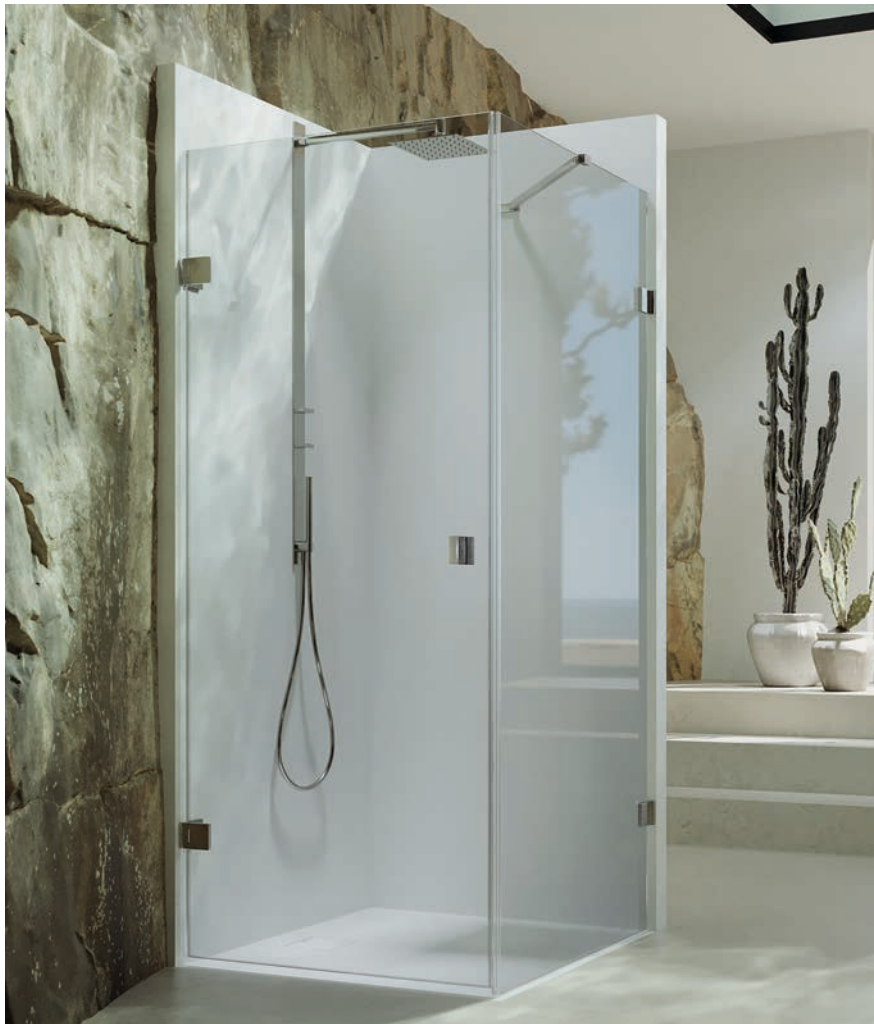
Schwingtür mit Seitenwand