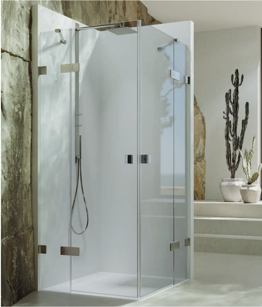
Schwingtüreckeinstieg mit festen Segmenten