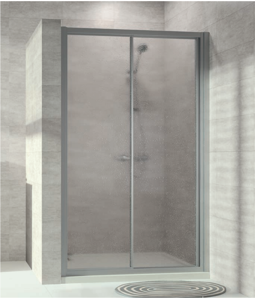
Gleittür 1 teilig mit festem Segment in Nische