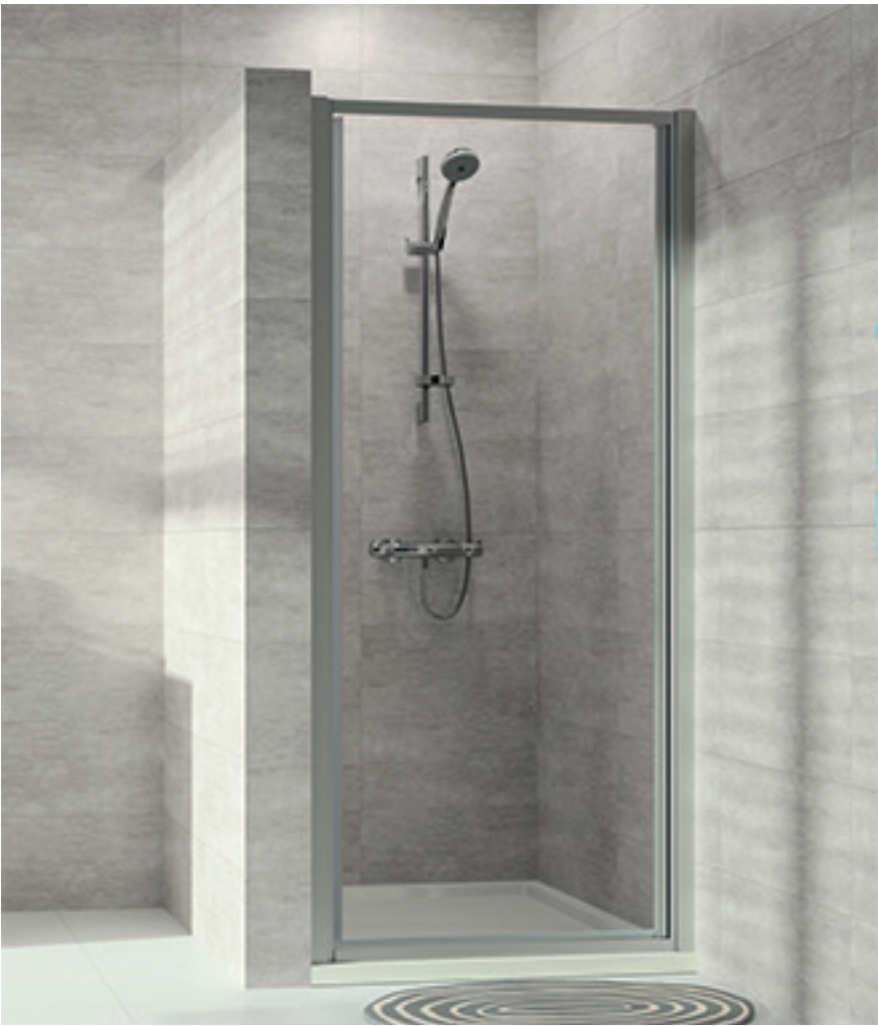
Schwingtür in Nische