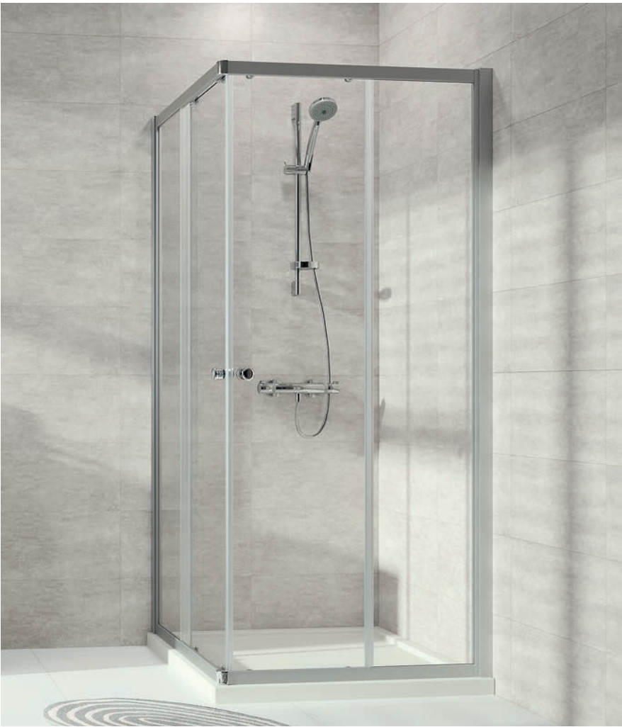
Gleittüreckeinstieg 2 teilig