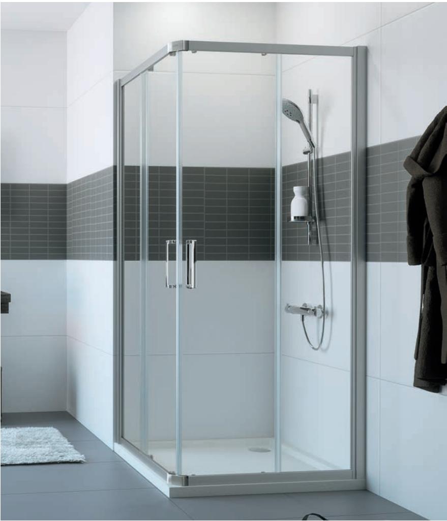
Gleittüreckeinstieg 2 teilig