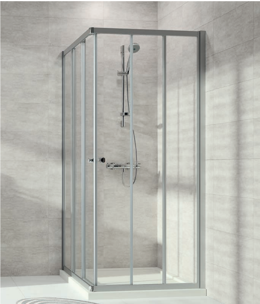
Gleittüreckeinstieg 3 teilig