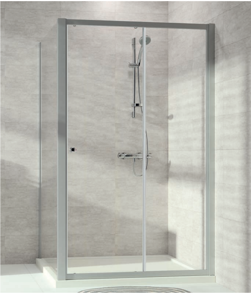
Gleittür 1 teilig mit festem Segment mit Seitenwand