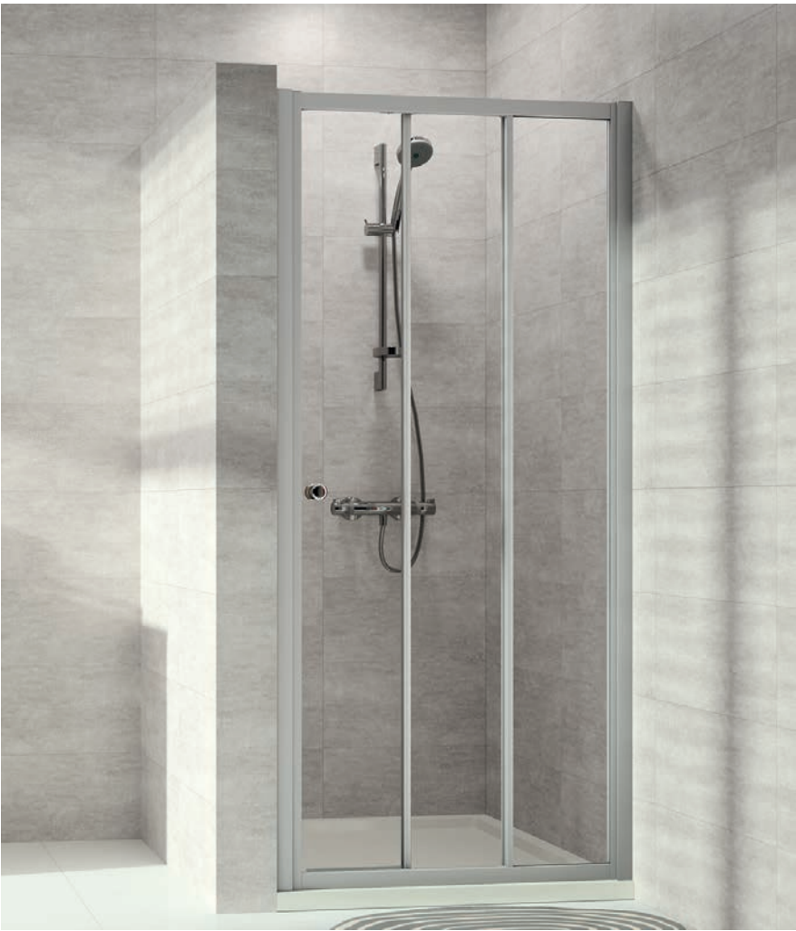
Gleittür 2 teilig mit festem Segment in Nische