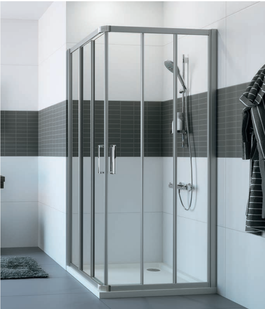
Gleittüreckeinstieg 3 teilig