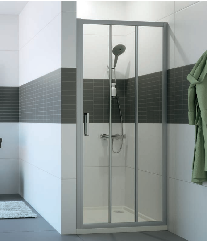
Gleittür 2 teilig mit festem Segment in Nische