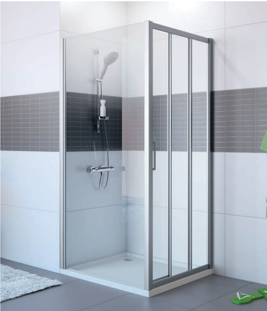
Seitenwand mit Gleittür 2 teilig mit festem Segment