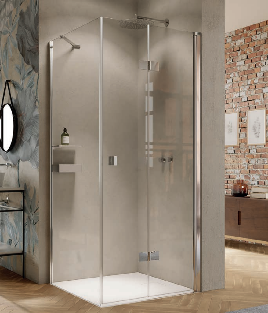
Schwingfalttür mit Seitenwand