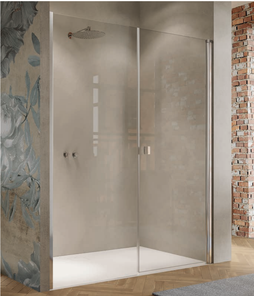
Schwingtür mit Nebenteil in Nische