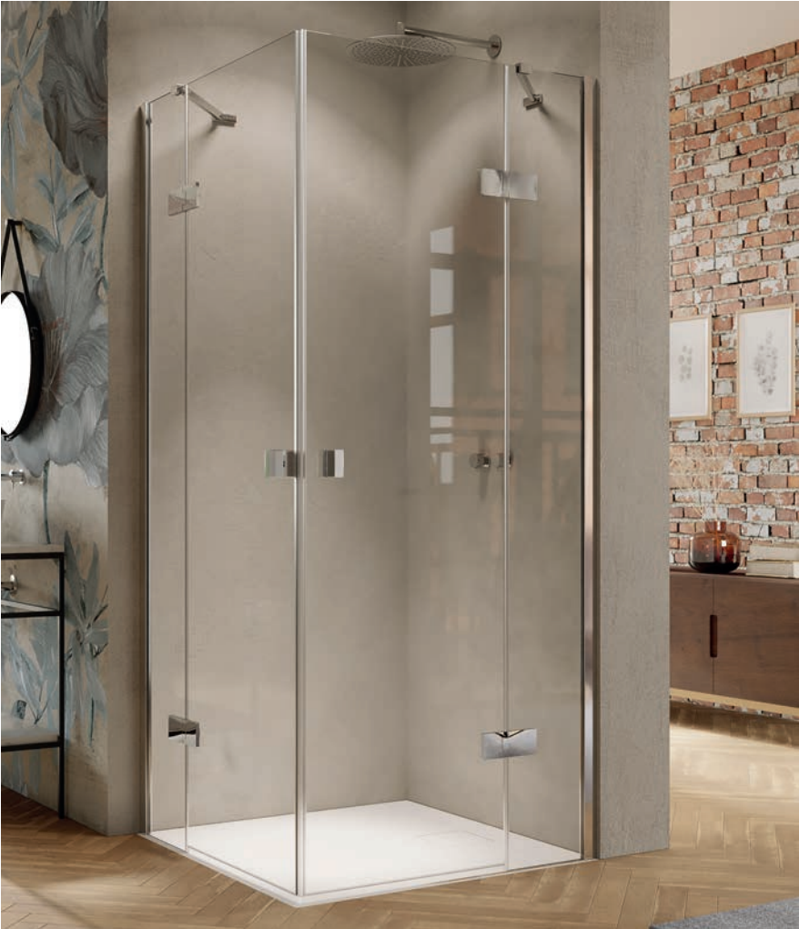
Schwingtüreckeinstieg mit festen Segmenten