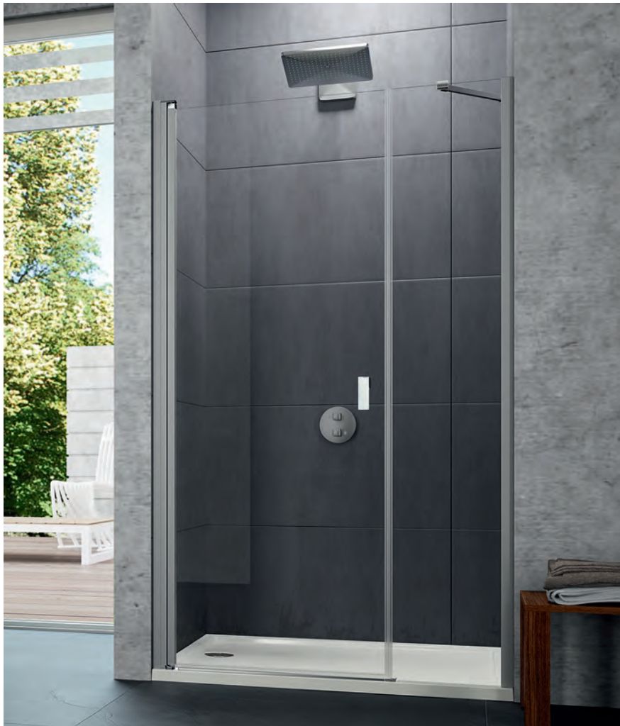
Schwingtür mit Nebenteil in Nische