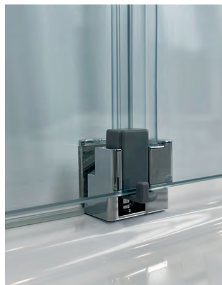
Nach innen aushakbare Gleittürsegmente für eine leichte Reinigung