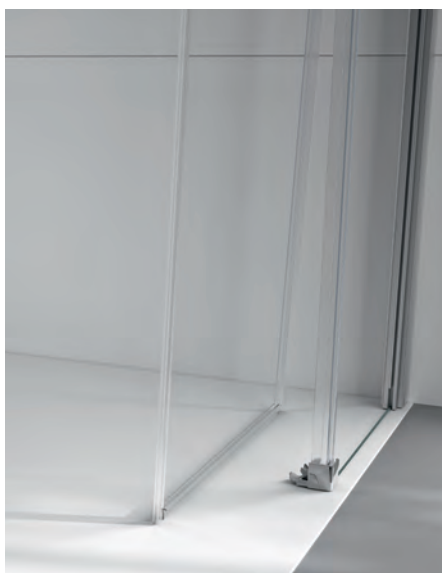
Aushakbare Türsegmente für eine leichte Reinigung dank der bewährten Reinigungstaste