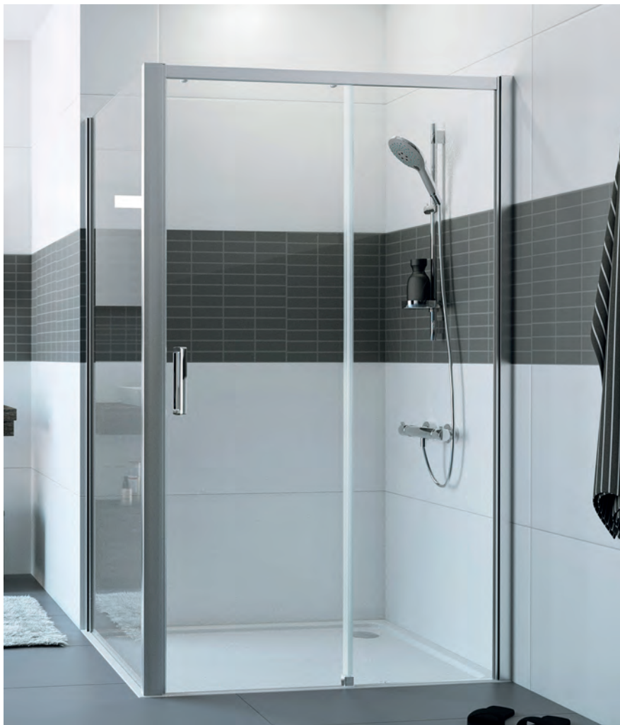
Seitenwand mit Gleittür 1 teilig mit festem Segment