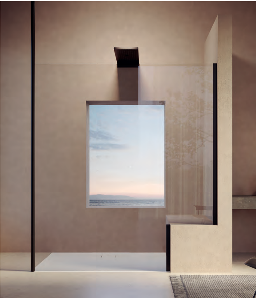
Walk-In Seitenwand alleinstehend