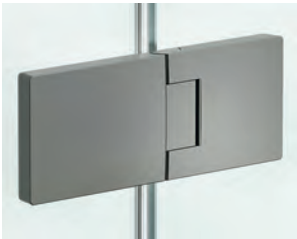
stainless steel optic