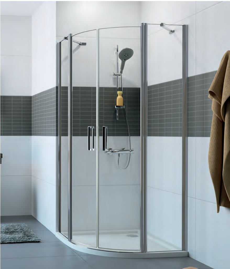
Schwingtür mit festen Segmenten 2-flügelig