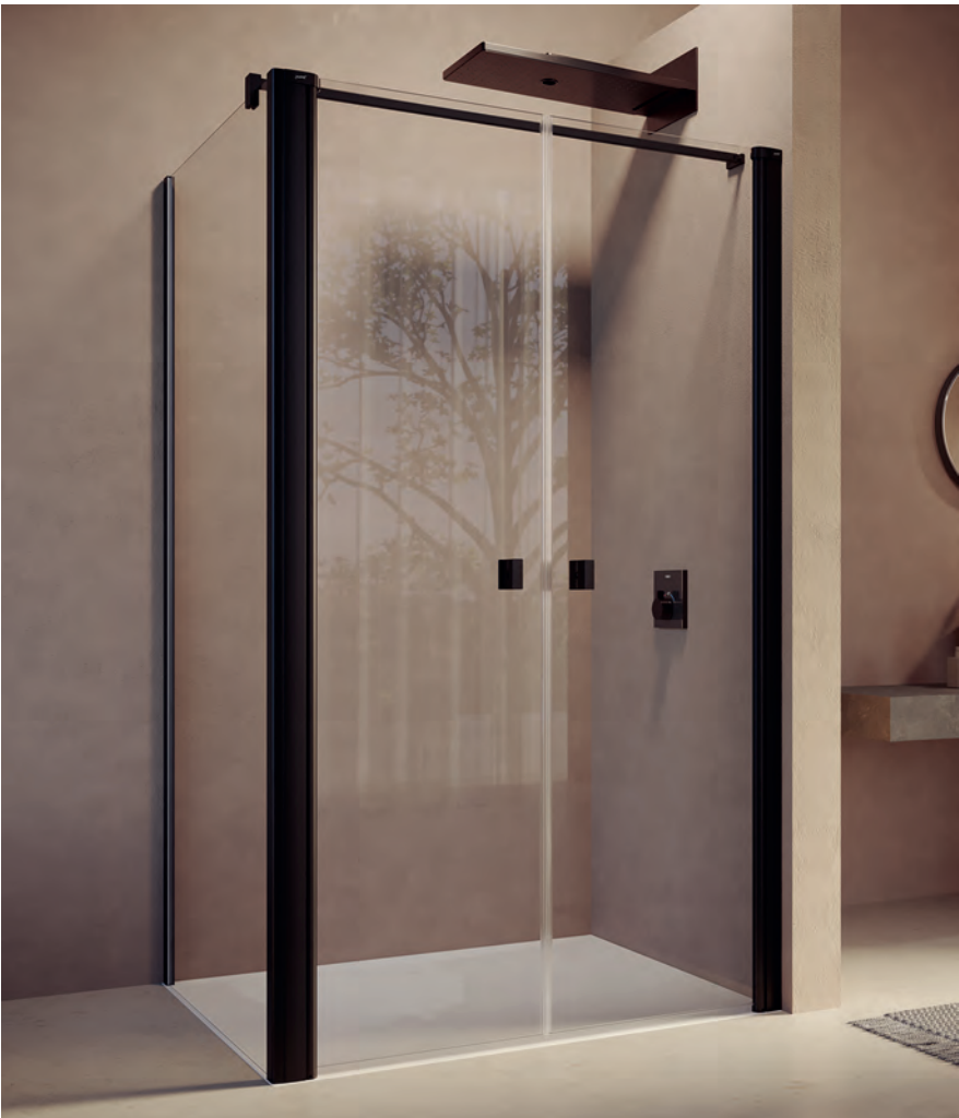
Pendeltür mit Seitenwand