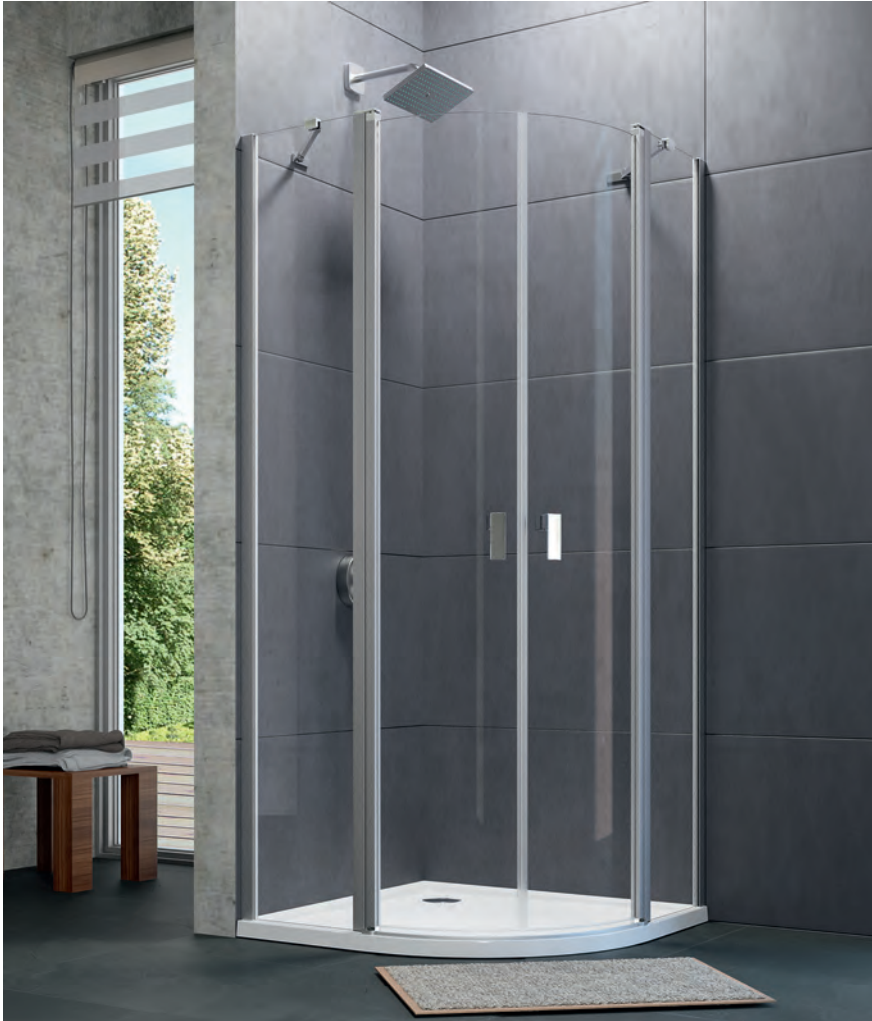
Schwingtür mit festen Segmenten 2-flügelig