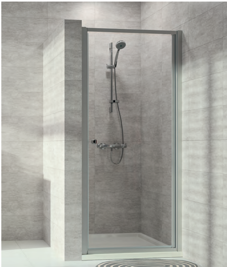
Schwingtür in Nische