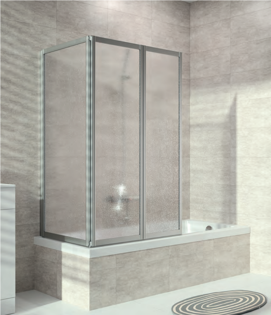
Badewannenabtrennung 3-teilig mit breitem Segment