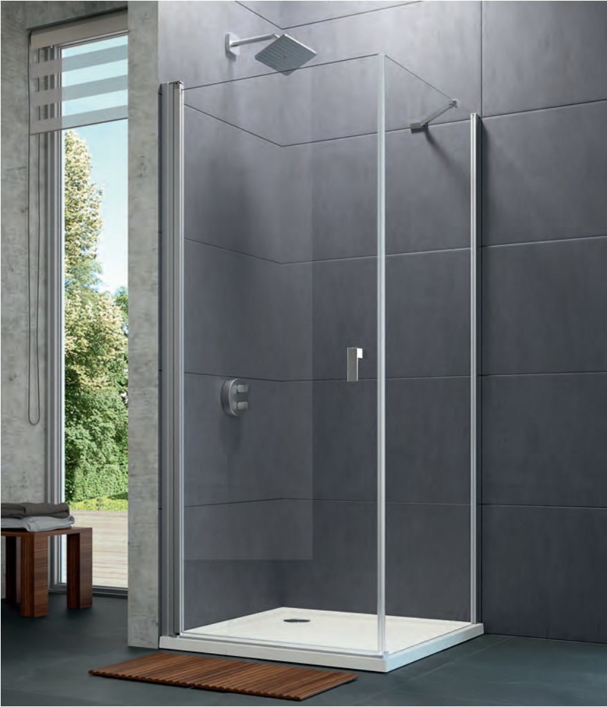
Seitenwand mit Schwingtür