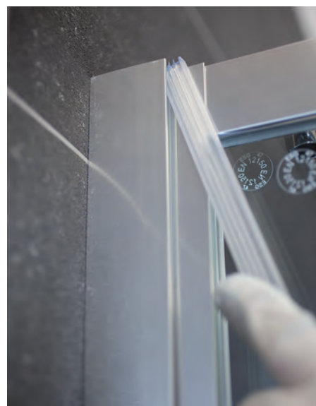
Leichte Montagetechnik durch das HÜPPE Kedersystem - geschützte, sehr einfache Montage in bewährter Vorgehensweise - keine sichtbaren Schrauben im Bereich der Wandleiste