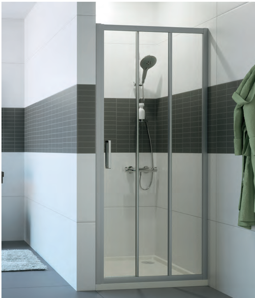
Gleittür 2 teilig mit festem Segment in Nische