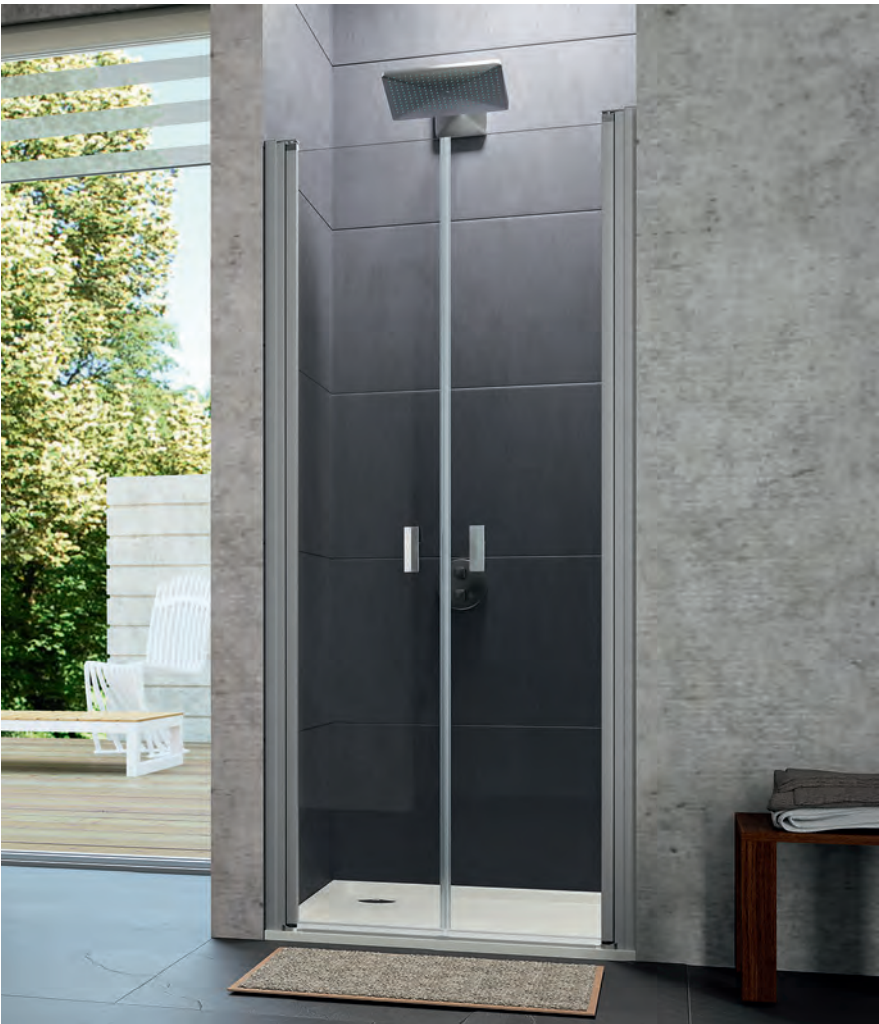
Pendeltür in Nische