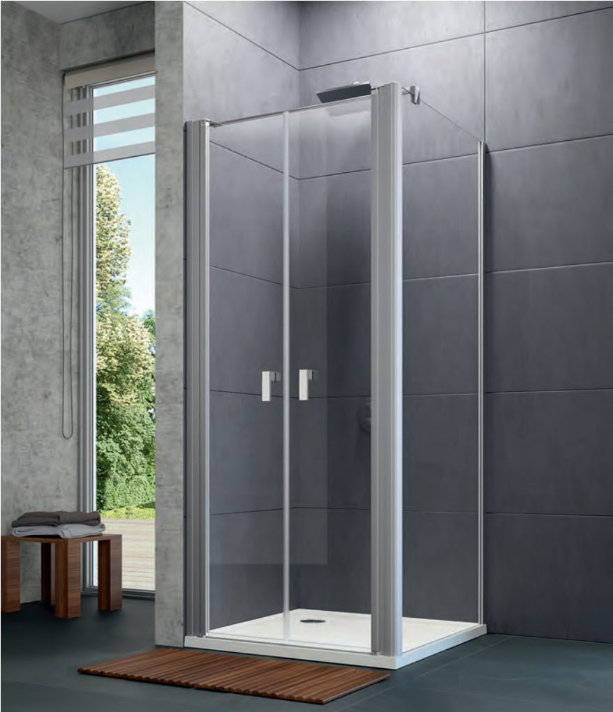
Pendeltür mit Seitenwand