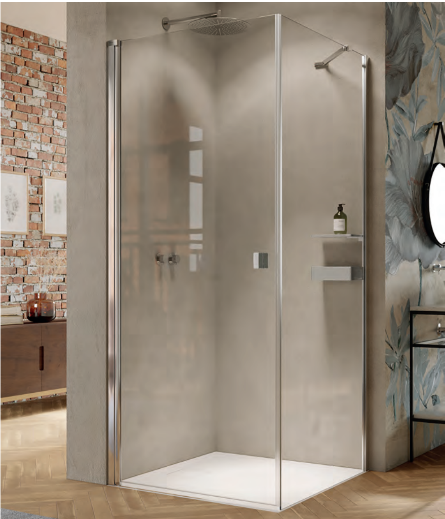
Seitenwand für Schwingtür