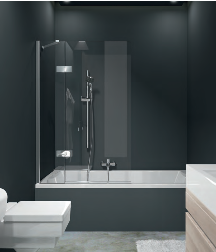
Badewannenabtrennung 1-teilig mit festem Segment