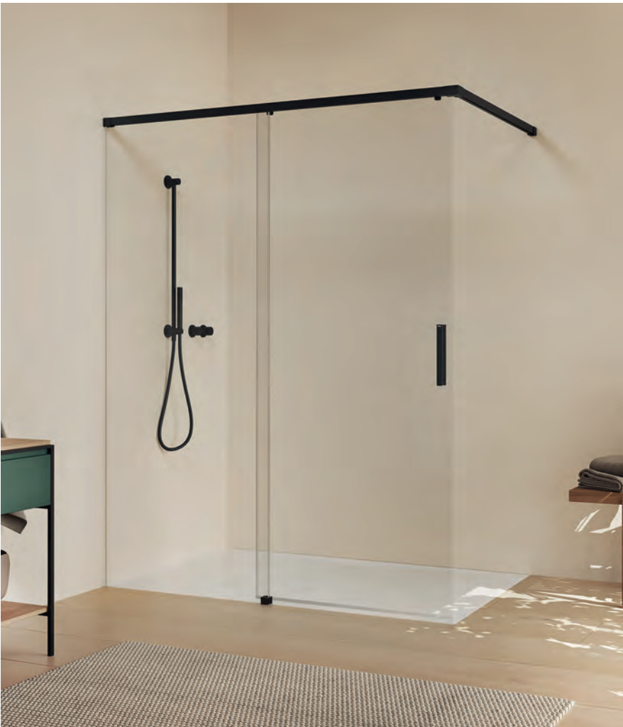
Walk-In Gleittür 1-teilig mit festem Segment