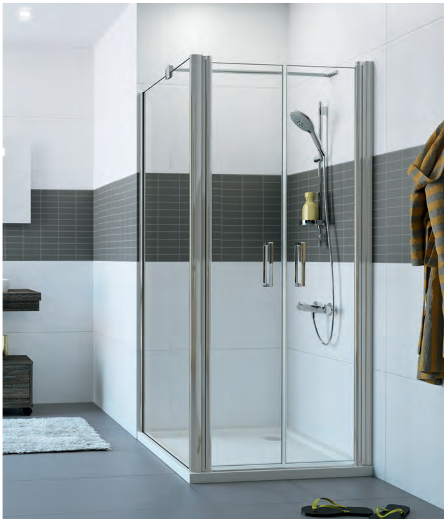
Pendeltür mit Seitenwand