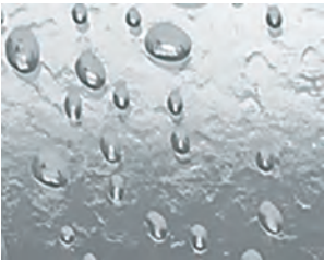
Kunstglas Pacific S klar