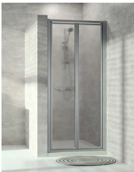
Pendeltür in Nische, Kunstglas