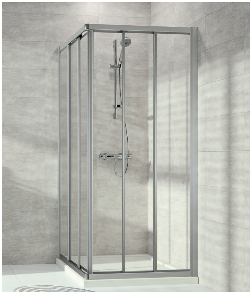
Gleittüreckeinstieg 3 teilig