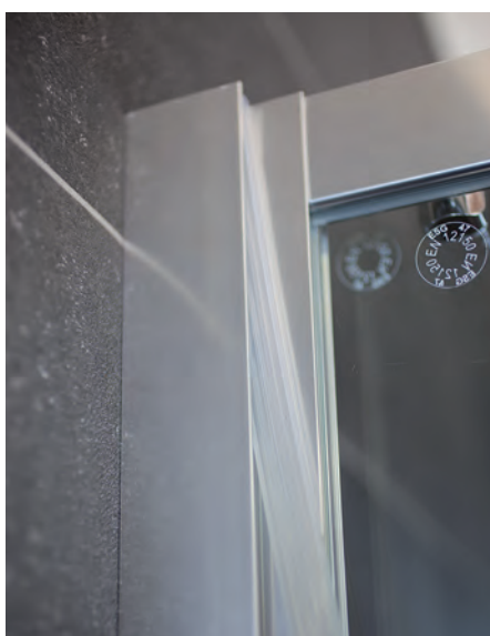
Leichte Montagetechnik durch das HÜPPE Kedersystem - geschütztes, sehr einfache Montage in bewährter Vorgehensweise - keine sichtbaren Schrauben im Bereich der Wandleiste