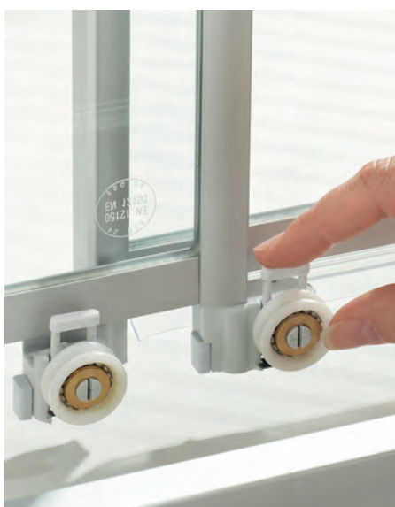
Die aushakbaren Rollen ermöglichen eine einfache Reinigung der Segmente.