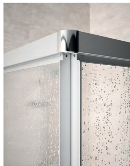
Hochwertiger verchromter Eckverbinder in Kombination mit geradlinigen Griffleisten