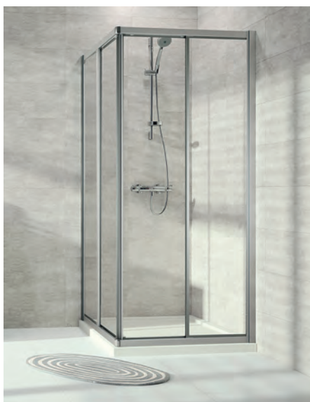
Gleittüreckeinstieg 2-teilig, Echtglas