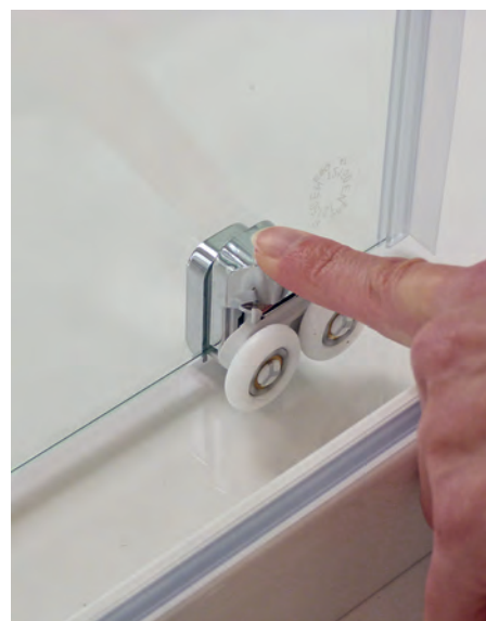
Aushakbare Türsegmente für eine leichte Reinigung bei allen Gleittürmodellen

Eckverbinder, Knaufgriff und Scharnierabdeckkappen immer in silber hochglanz.