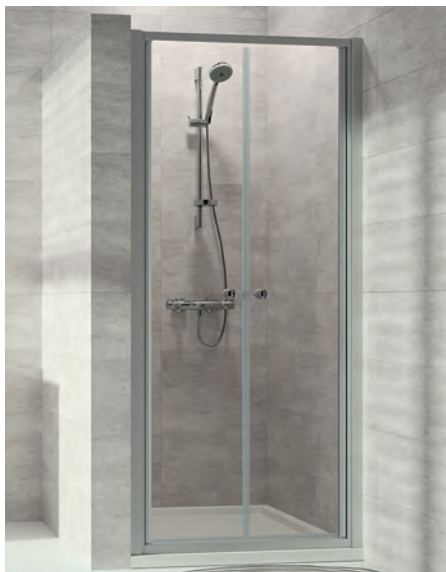
Pendeltür in Nische, Echtglas