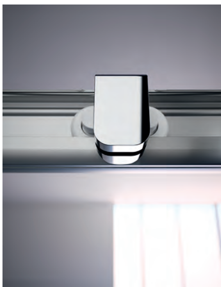
Hochwertige Doppelrollen für ein leichtgängiges Öffnen und Schließen der Gleittüren