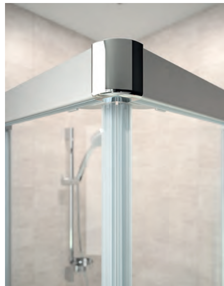
Hochwertiger verchromter Eckverbinder