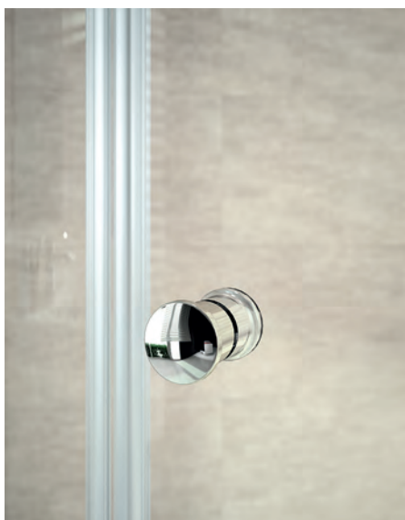
Knaufgriff bei teilgerahmter Ausführung