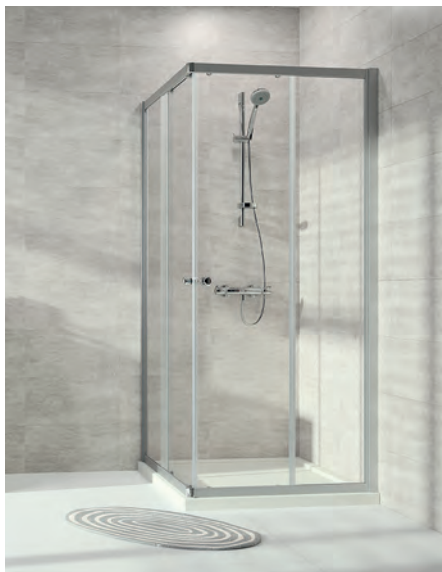
Gleittüreckeinstieg 2-teilig, Echtglas