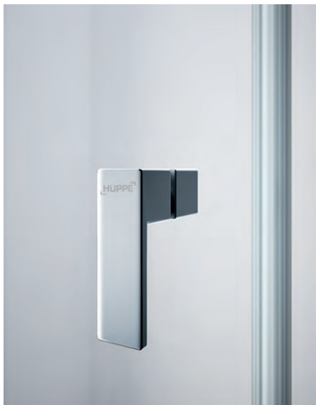
Griff HÜPPE Design pure