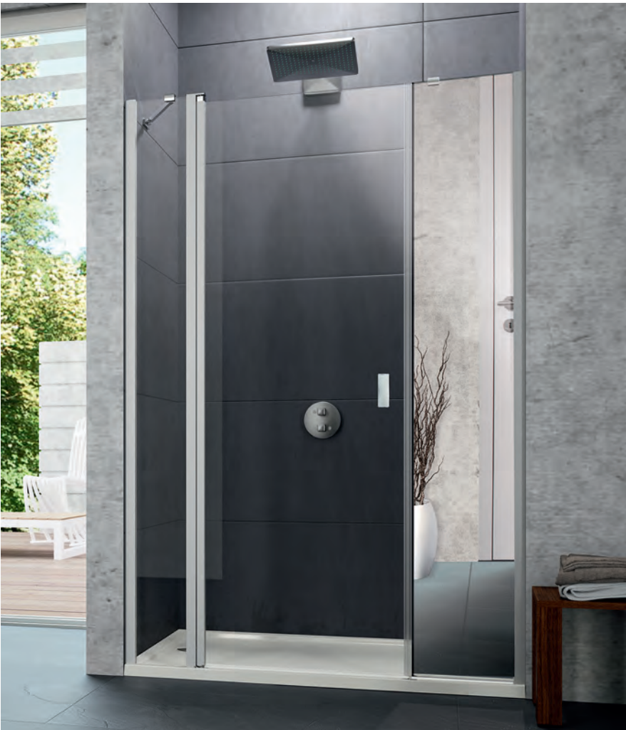
Schwingtür mit festem Segment und Nebenteil in Nische