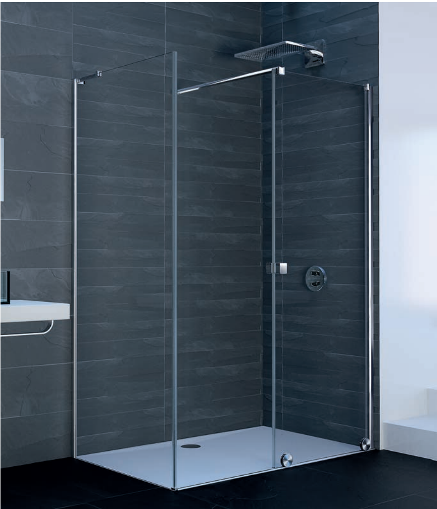
Seitenwand mit Walk-In Gleittür, 1 teilig mit festem Segment