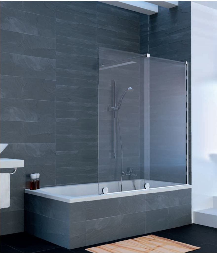
Gleittür 1teilig mit festem Segment