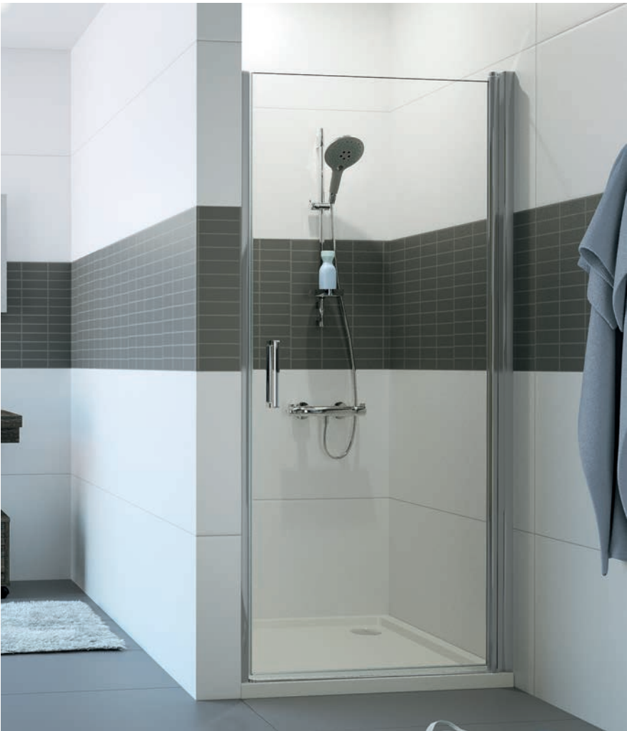
Schwingtür in Nische