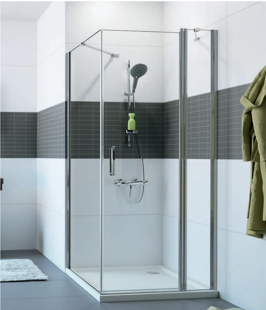
Seitenwand mit Schwingtür mit festem Segment