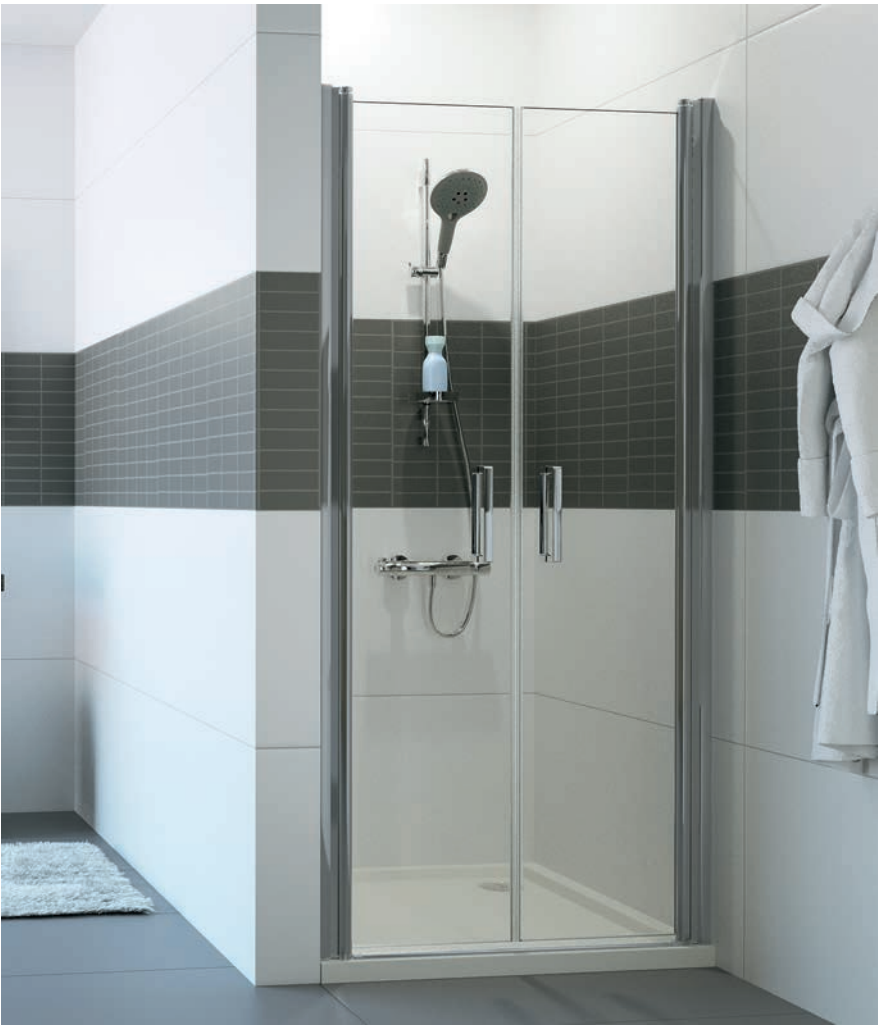
Pendeltür in Nische