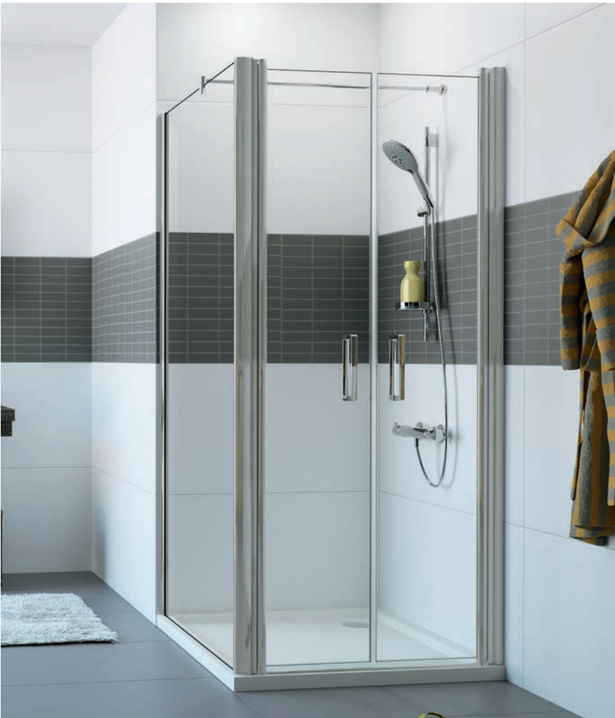
Pendeltür mit Seitenwand