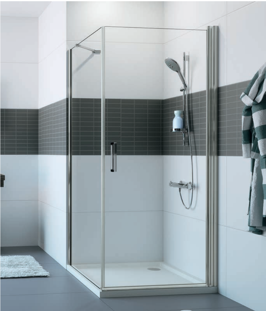
Schwingtür mit Seitenwand