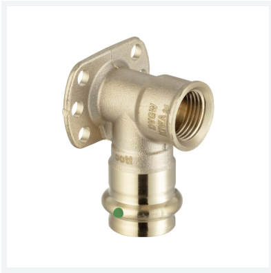
Sanpress-Wandscheibe mit SC-Contur Modell 2225.5 Artikel 335 236